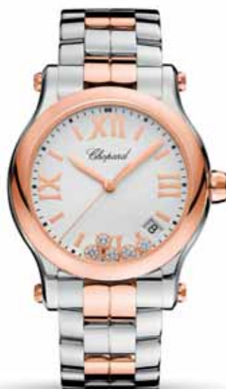
Chopard Happy Sport 36 mm, 11 400 €

Šperky Happy Diamonds sú nadčasové a hravé vďaka pohyblivým diamantom, ktoré jemne tancujú a otáčajú sa. Hodinky Happy Sport sa zase stali prvou odvážnou kombináciou vzácných drahokamov (diamantov) s neočakávaným materiálom (s ušľachtilou oceľou). Keďže sa tieto Chopard ikonické hodinky môžu pochváliť nekonečným počtom variácií, ľahko k nim doladíte set šperkov Happy Diamonds a nájdete tak svoj vlastný symbol osobnej elegancie.