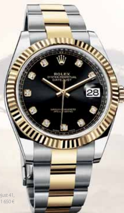
Rolex Datejust 41, 11 650 €