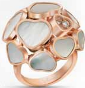
Chopard Happy Hearts, 5 960 €