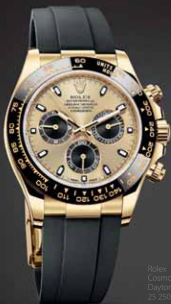
Rolex Cosmograph Daytona, 25 250 €

Oyster Perpetual Cosmograph Daytona je dokonalý chronograf Rolex. Efektívny, presný, čitateľný, robustný, spoľahlivý a vodotesný automat, ktorý je zároveň komfortný, elegantný, nadčasový a vysoko presný. Pri posudzovaní úspechu a vynikajúcej povesti sa v mnohých ohľadoch považuje za najlepší chronograf na svete.