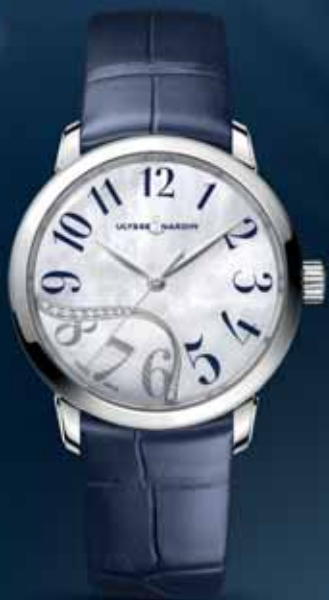
Ulysse Nardin Jade, 6 900 €