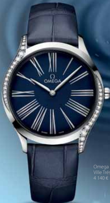
Omega De Ville Trésor, 4 140 €

The intense blue dial brings a piece of light to the depths of the dark blue oceans with luminescent details with five moving diamonds – resembling air bubbles or small fish floating around this beautiful aquarium.