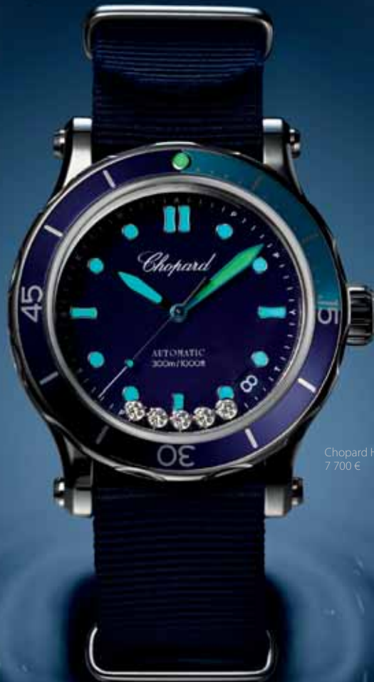
Chopard Happy Ocean, 7 700 €