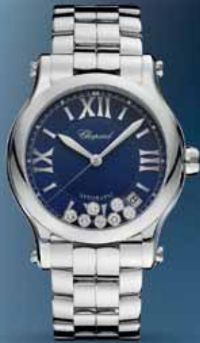
Chopard Happy Sport 36 mm, 8 280 €

Tmavé vody oceánu, sila vlnobitia a prúdov, ktoré nás zanesú do neznámych končín, k novým začiatkom, lepším zajtrajškom. Ulysse Nardin, Omega aj Chopard sa inšpirovali krásou modrej farby, pričom spleť jej odtieňov pretavili do svojich hodinek.