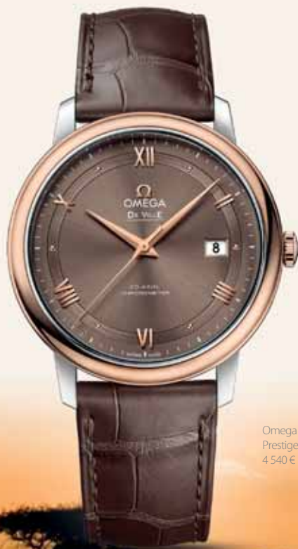
Omega De Ville Prestige Co-Axial 39,5 mm, 4 540 €

A place that you cannot deny loving after just one breath of the African air. With the sureness of a predator, we guide you through beautiful places, wilderness and beaches. Meet Africa, which still doesn't let travellers sleep, and get ready for an adventure with watches and jewellery from Sheron jewellery shop.