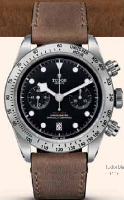
Tudor Black Bay Chrono, 4 440 €