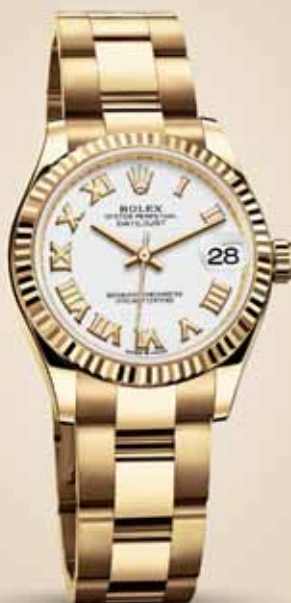
Rolex Datejust 31, 23 600 €