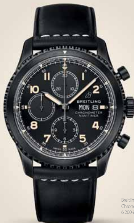
Breitling Navitimer 8 Chronograph 43, 6 200 €