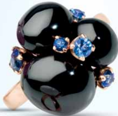
Pomellato Capri, 1 880 €