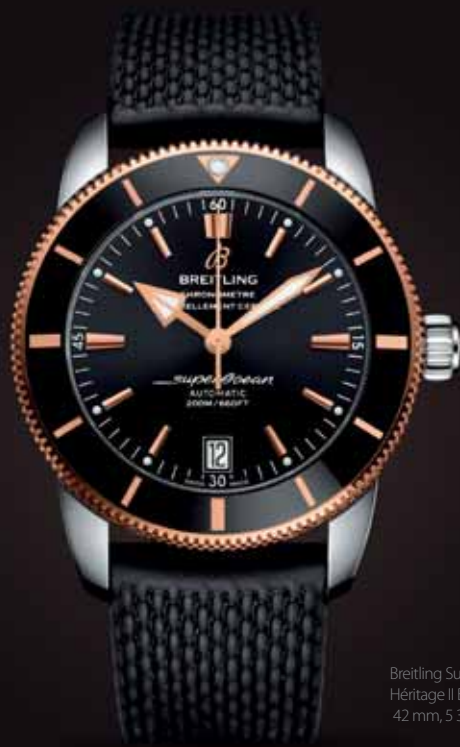
Breitling Superocean Héritage II B20 Automatic, 42 mm, 5 370 €

Robustný model ukrýva mechanický strojček s automatickým náťahom so 70-hodinovou rezervou chodu. Manufaktúrny kaliber Breitling B20 je osvedčený uznávaným certifikátom C.O.S.C a vznikol na základe modelu kalibru Tudor MT5612, ako dôsledok spolupráce dvoch skvelých značiek, ktoré zdieľajú svoje odborné znalosti vo vývoji a výrobe vybraných mechanických strojčekov.