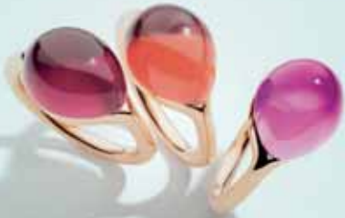
Pomellato Rouge Passion, od 890 €