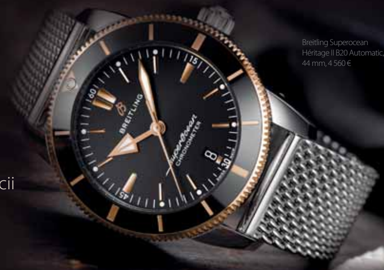
Breitling Superocean Héritage II B20 Automatic, 44 mm, 4 560 €

Trojručičková verzia hodínok poháňaných novým manufaktúrnym kalibrom Breitling B20. Superocean Héritage II B20 Automatic v kombinácii ohromujúcej ušľachtilej ocele a zlata vytvára nepriestrelnú kombináciu s oceľovým alebo kaučukovým remienkom Aero Classic. Tento exkluzívny model je k dispozícii v 44-mm a 42-mm verzii.