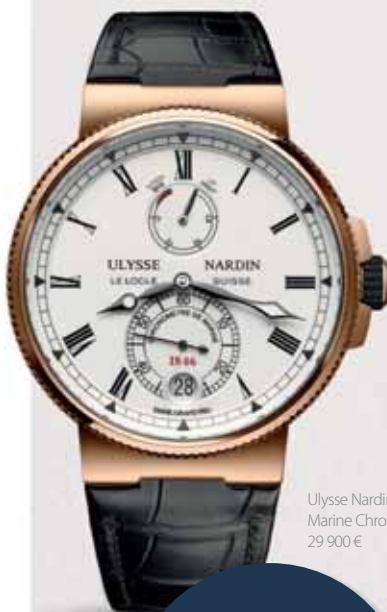
Ulysse Nardin Marine Chronometer, 29 900 €

„Diamond on silicium“ is a revolutionary combination of silicon and synthetic diamond, patented by the Ulysse Nardin manufactory and used in the escapement. This material is extremely light, paramagnetic and, most importantly, thanks to the thin layer of diamond dust, it does not require lubrication and offers higher energy efficiency.