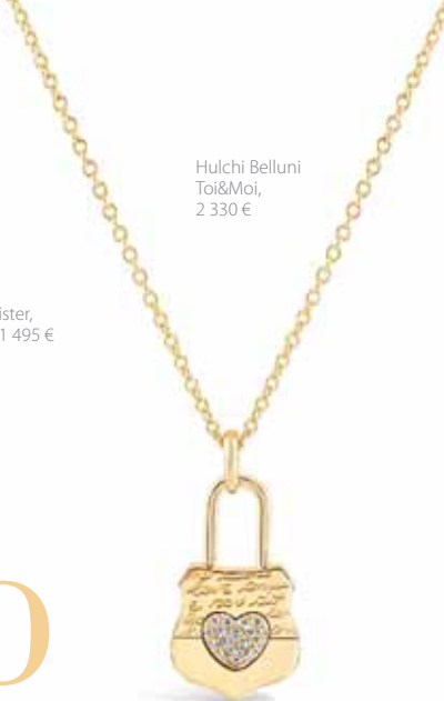
Hulchi Belluni Toi&Moi, 2 330 €