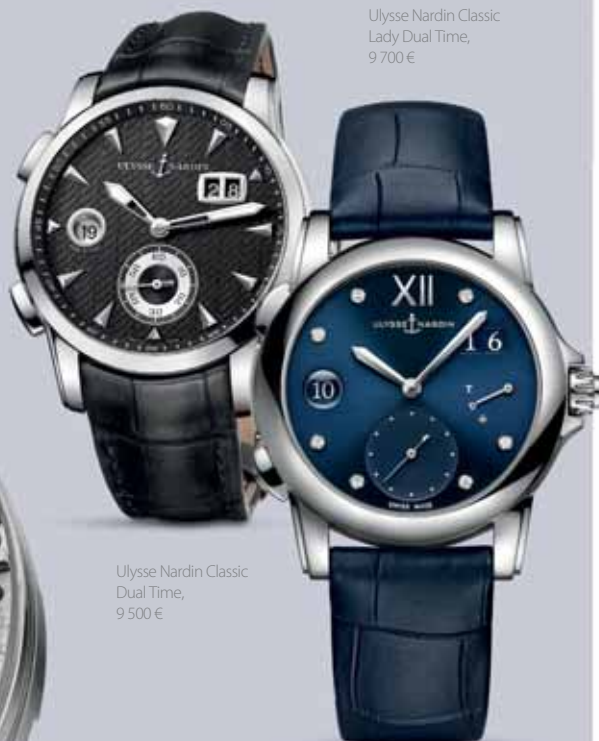
Ulysse Nardin Classic Dual Time, 9 500 €