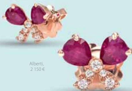
Alberti, 2 150 €