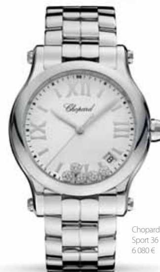
Chopard Happy Sport 36 mm, 6 080 €