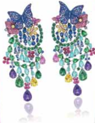
Chopard Haute Joallerie collection