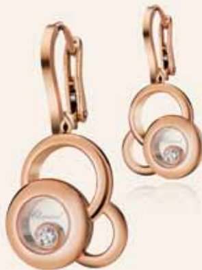
Chopard Happy Dreams, 3 310 €