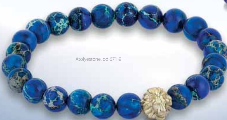
Atolyestone, od 671 €