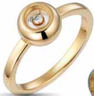
Chopard Miss Happy, 1 410 €