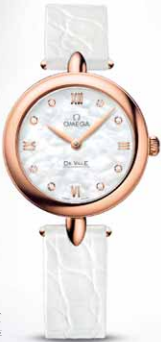
Omega De Ville Prestige "Dewdrop" 7 970 €