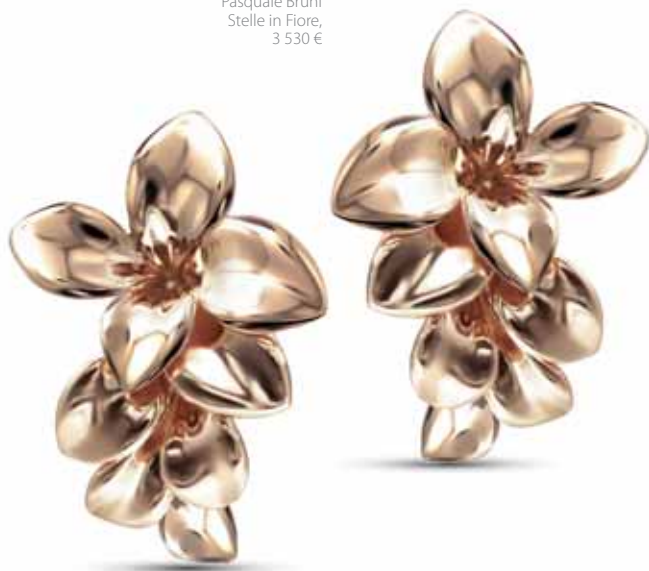
Pasquale Bruni Stelle in Fiore, 3 530 €

Je to okúzlenie hviezdami na nočnej oblohe a krása kvetov cez deň, ktoré vytvorili Stelle In Fiore, kolekciu Pasquale Bruni inšpirovanú tancom listov, ktoré cestujú ako padajúce hviezdy počas drahocenných nocí a svojím teplom prvých ranných lúčov osvetľujú zelené záhrady.