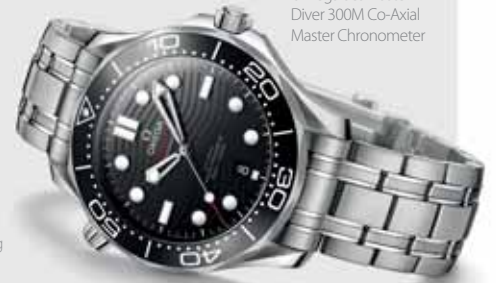
Omega Seamaster Diver 300M Co-Axial Master Chronometer

The escapement developed by Omega in 1999 consists of modifying the classic Swiss escapement by adding the third spectrum to the pallet - thereby reducing the wear and increasing the efficiency of the escapement. This ensures the greater accuracy and longer life of the clockwork.