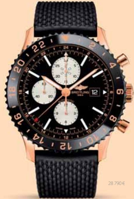
28 790 €