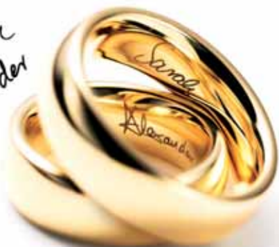
Meister obrúčky, cena za pár od 1 080 €