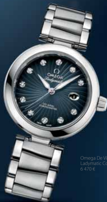
Omega De Ville Ladymatic Co-Axial 34 mm, 6 470 €