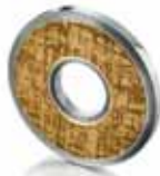
Meister, od 385 €