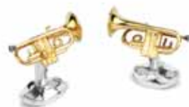
manžetové gombiky Deakin&Francis, 300 €