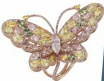
Chopard Haute Joallerie collection