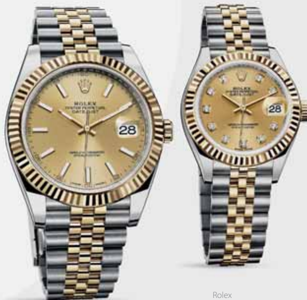
Rolex Lady-Datejust 28, 10 150 €