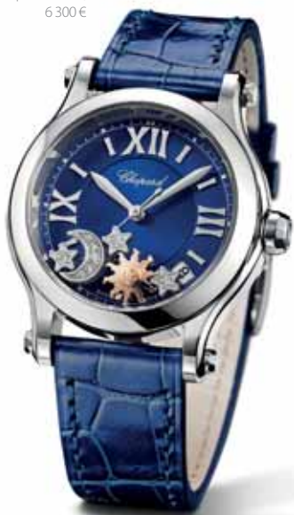
Chopard Happy Sport 36 mm, 6 300 €

ikonickú kolekciu dámskych šperkov a hodiniiek Chopard