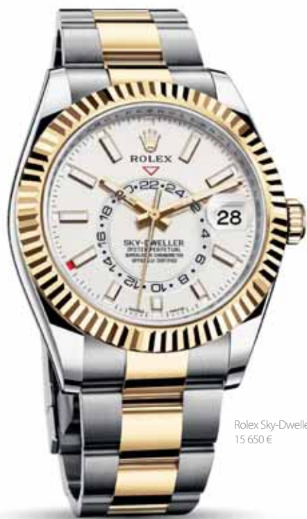
Rolex Sky-Dweller, 15 650 €