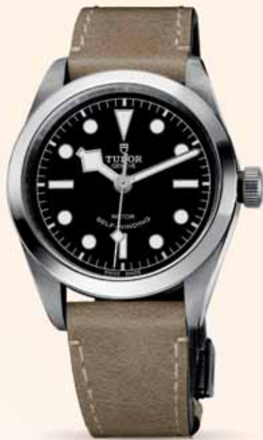
Tudor Black Bay 36, 2 370 €