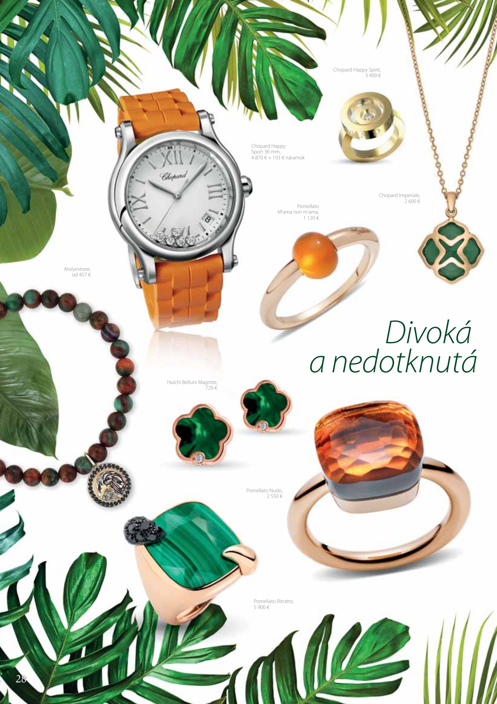
Chopard Happy Spirit, 3 400 €