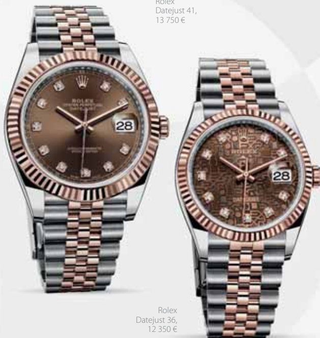
Rolex Datejust 36, 12 350 €