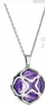
Chopard Imperiale, 2 400 €