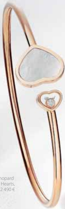
Chopard Happy Hearts, 2 490 €