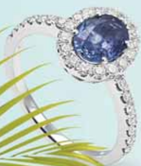
Alberti, 3 300 €

Doprajte si nádych tropickej dovolenky v klenotníctve SHERON. Nápadné palmy, syté ibištekové kvety, výrazné farby, akými sú pomarančovo-oranžová, kiwi zelená, žiarivo azúrovo-modrá či fuchsiovo-ružová vládnu v tropickej džungli plnej exotických živočíchov a rastlín. Nechajte sa vtiahnuť do pralesa, ktorý žiari všetkými odtieňmi zelenej!