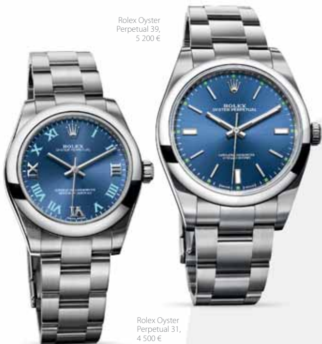
Rolex Oyster Perpetual 31, 4 500 €