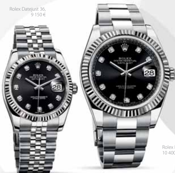
Rolex Datejust 41, 10 400 €