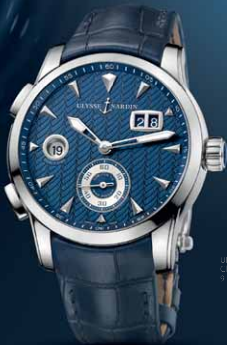
Ulysse Nardin Classic Dual Time, 9 500 €