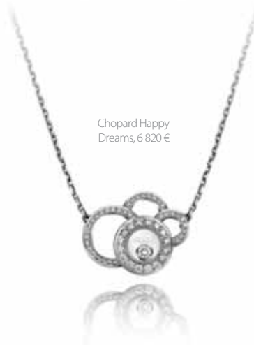
Chopard Happy Dreams, 6 820 €