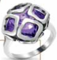
Chopard Imperiale, 3 490 €