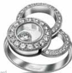
Chopard Happy Dreams, 5 740 €