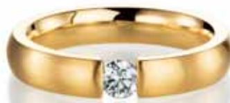
Meister, od 1 495 €