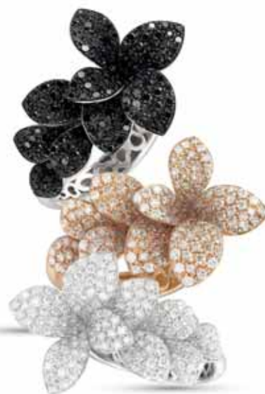
Pasquale Bruni Stelle in Fiore, od 4 510 €