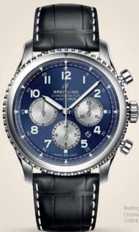
Breitling Navitimer 8 B01 Chronograph 43, 7 000 €

During Baselworld 2018, Breitling brought to life five impressive members of the new Navitimer 8 assortment: Navitimer 8 B01, Navitimer 8 Unitime, Navitimer 8 Day & Date, Navitimer 8 Automatic and Navitimer 8 Chronograph. At Sheron, we have looked at their chronographs in more detail in order to introduce and compare their performance, features and designs.