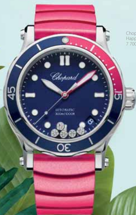
Chopard Happy Ocean, 7 700 €