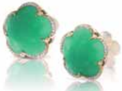
Pasquale Bruni Bon Ton, 2 450 €