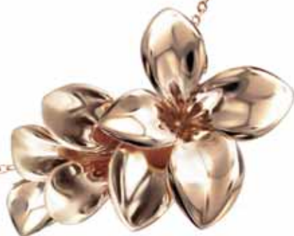
Pasquale Bruni Stelle in Fiore, 2 090 €

Irresistible stars in bloom shine on the woman in all shades of gold. The gorgeous contrast of black and white diamonds gives an impression of a dark night being crossed by a glare of warm morning rays. Eugenia Bruni, the creative director of the Italian jewellery brand Pasquale Bruni, claims that: "Nature always loves us, during the day with flowers and at night with stars."