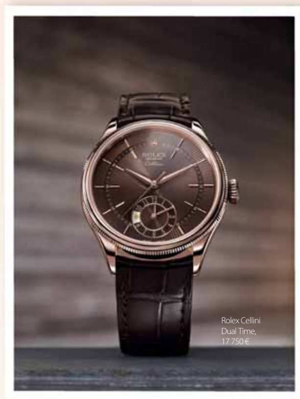
Rolex Cellini Dual Time, 17 750 €

By combining red and yellow, the colour brown is created. These three colours are a clear sign of the African continent – red and brown soil, the yellow savannahs. Carry a piece of Africa with you and think about Rolex during your adventures and experiences in this amazing continent.