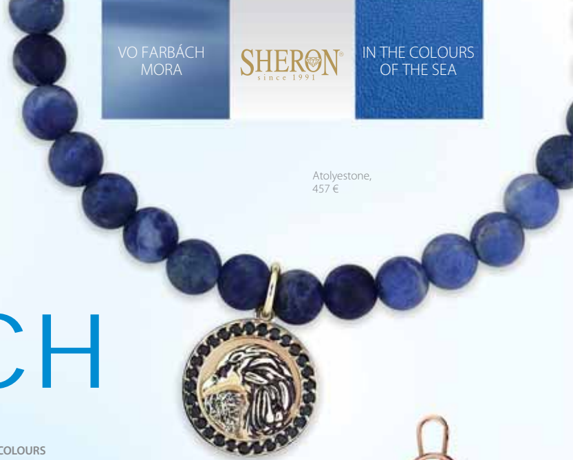
Atolyestone, 457 €