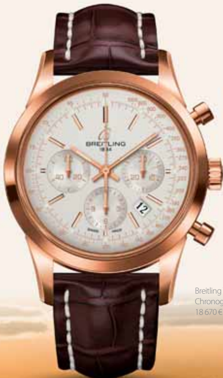
Breitling Transocean Chronograph, 18 670 €