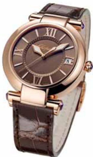
Chopard Imperiale 40 mm, 18 100 €