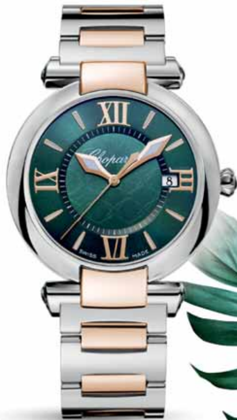
Chopard Imperiale 36 mm, 7 620 €