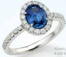
Alberti, 4 600 €