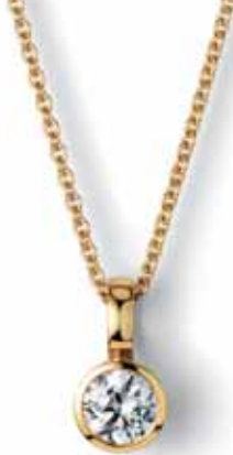
Alberti, od 475 €