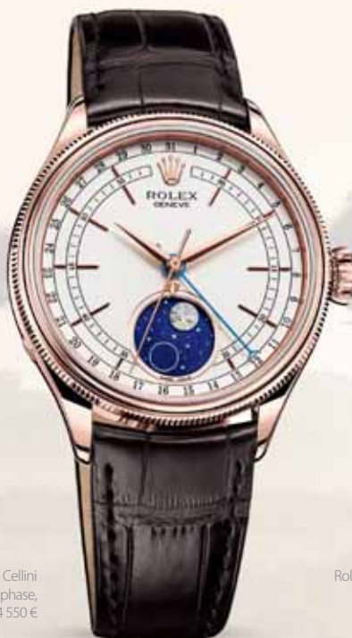
Rolex Cellini Moonphase, 24 550 €