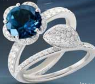
Pasquale Bruni Petit Garden, 1 940 €