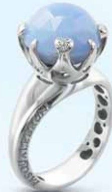
Pasquale Bruni Sissi, 1 980 €