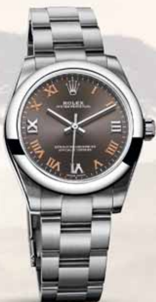
Rolex Oyster Perpetual 31, 4 500 €