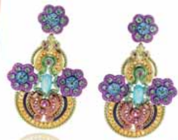
Chopard Haute Joallerie collection