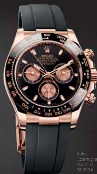
Rolex Cosmograph Daytona, 26 350 €

Názov Cosmograph, s ktorým prišla spoločnosť Rolex, naznačuje, že ide o jedinečný, odlišný a inovatívny model. Sčítače chronografu sú jasne čitateľné vďaka silno kontrastnej farbe a kombinácii bledších a tmavších odtieňov. Tachymetrická stupnica – stupnica umožňujúca meranie priemernej rýchlosti – bola presunutá z číselníka na lunetu, čím sa samotný číselník zjednodušil a sprehladnil. Zároveň zdolal výzvu, ktorou bolo vytvoriť čitateľnejší chronograf. Rolex predstavil model hodín navrhnutý tak, aby spĺňal požiadavky profesionálnych pretekárov už v roku 1963. S vysoko spoľahlivým chronografom a lunetou s tachymet-