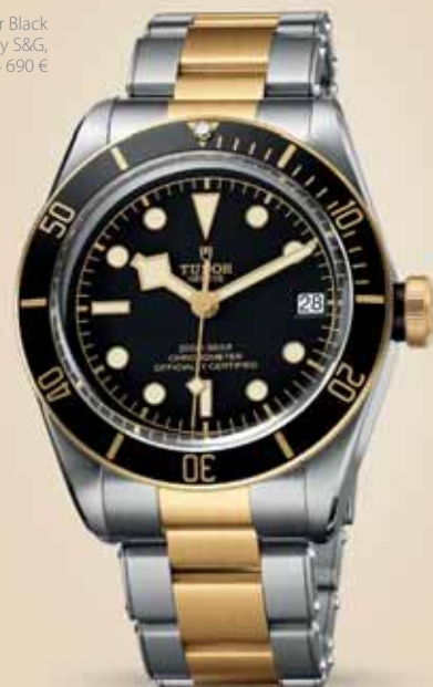
Tudor Black Bay S&G, 4 690 €