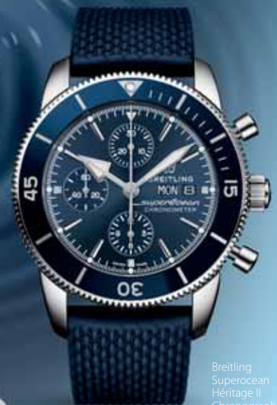
Breitling Superocean Héritage II Chronograph 44, 5 530 €