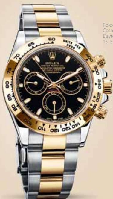
Rolex Cosmograph Daytona, 15 500 €