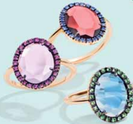
Pomellato Colpo Di Fulmine, od 2 000 €