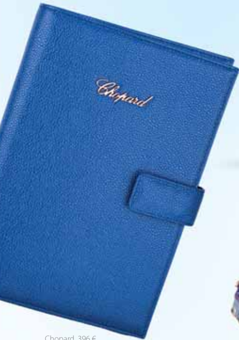
Chopard, 396 €