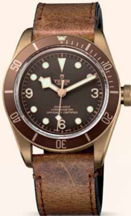
Tudor Black Bay Bronze, 3 750 €