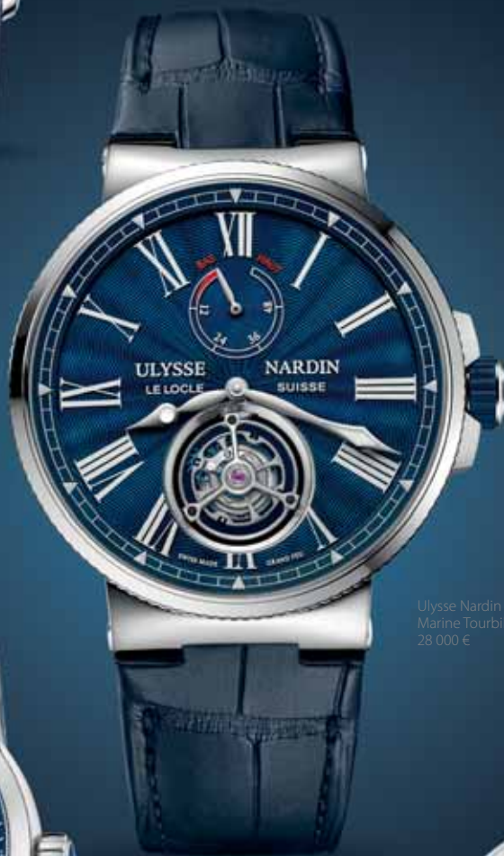
Ulysse Nardin Marine Tourbillon, 28 000 €