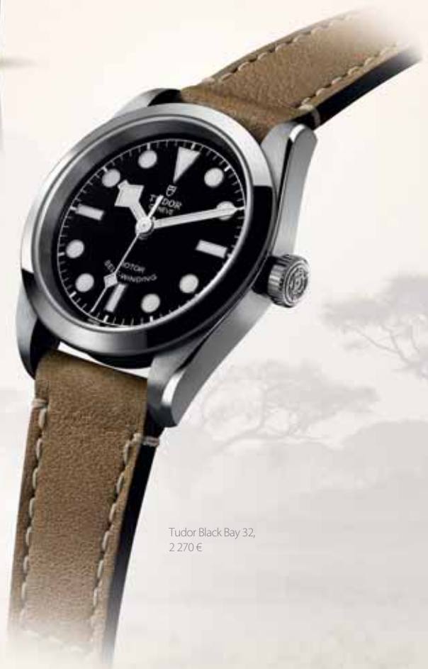
Tudor Black Bay 32, 2 270 €

A quality natural and stylish strap with a rough untreated look, but with precisely crafted details. Whether for an African safari or urban jungle, the Tudor watch is designed for adventurers.