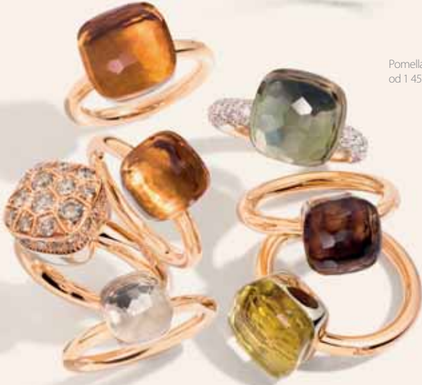
Pomellato Nudo, od 1 450 €