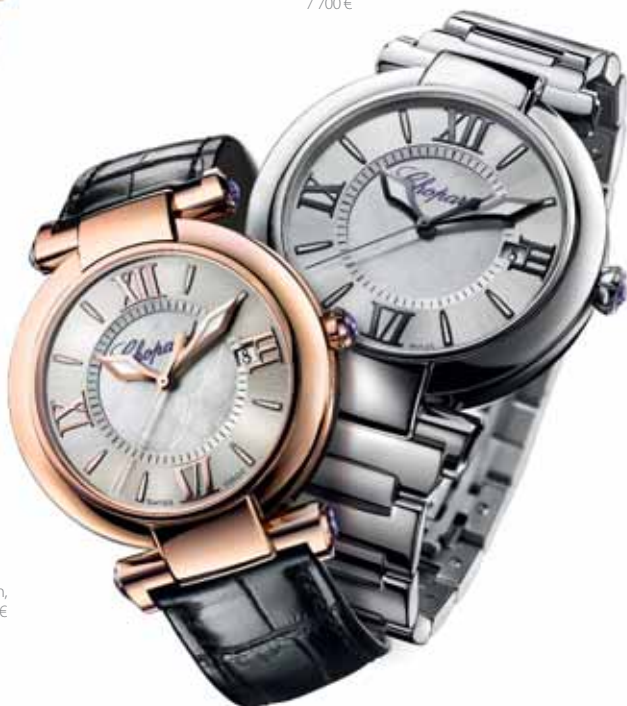
Chopard Imperiale 36 mm, 13 000 €