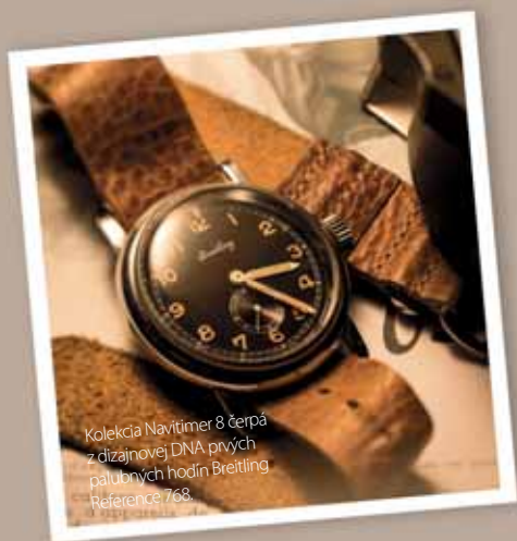
Kolekcia Navitimer 8 čerpa z dizajnovej DNA prvých palubných hodín Breitling Referenčné: 768