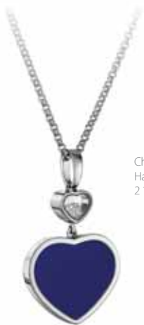
Chopard Happy Hearts, 2 180 €