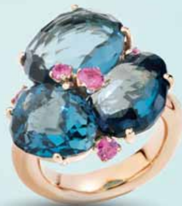
Pomellato Bahia, 9 400 €