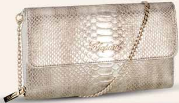
Chopard kabelka, 830 €