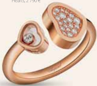
Chopard Happy Hearts, 2 790 €