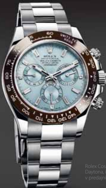
Rolex Cosmograph Daytona, info o cene v predajni